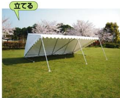
立てる 天幕をかぶせ、片足ずつたてます。 (支柱を持たなくても大丈夫)