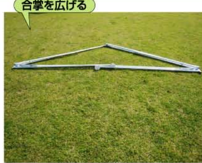
合掌を広げる 合掌を広げるだけ。