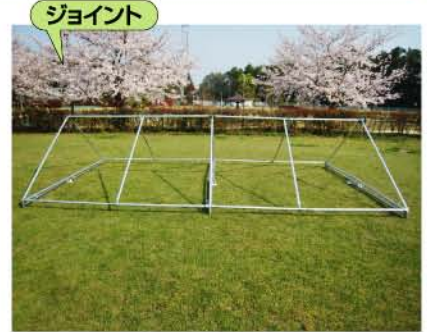
ジョイント 合掌のパーツに桁・棟を差し込みます。