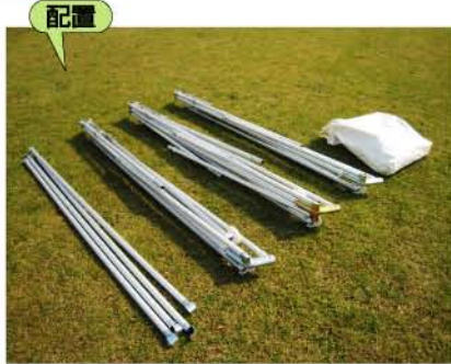
配置 4つのグループを配置するだけのカンタン作業。