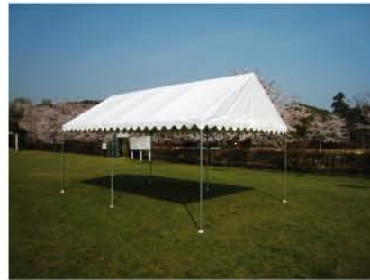
筋交いを引っかけ完成。